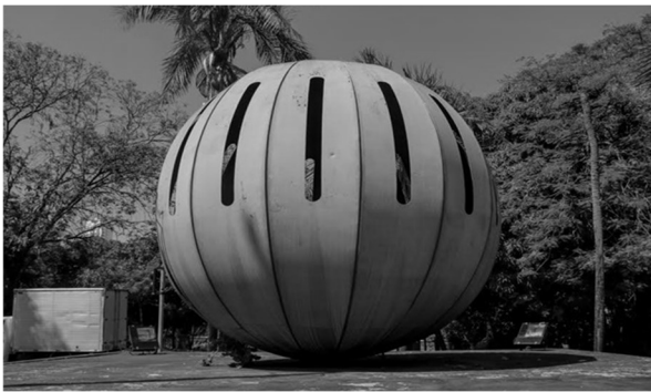
Monumento aos Mortos e Desaparecidos na Luta Contra a Ditadura Militar (Goiânia, GO). Disponível em: < https://www.aredacao.com.br/colunas/177707/monumento-representam-um-capitulo-da-historia-politica-de-goias >. Acesso em: 16 abr. 2023.