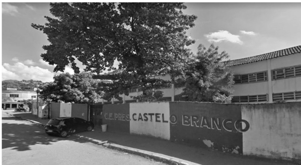
Colégio Estadual Presidente Castelo Branco (Mesquita, RJ). Disponível em: < https://g1.globo.com/educacao/noticia/2019/03/31/numero-de-escolas-com-nome-de-presidentes-da-ditadura-militar-cai-26percent-em-uma-decada.ghtml >. Acesso em: 16 abr. 2023.

Ambas as imagens representam lugares que remetem à história dos governos militares no Brasil, entre as décadas de 1960 e 1980. No entanto, há uma diferença na forma como rememoram esse passado, pois representam, respectivamente: